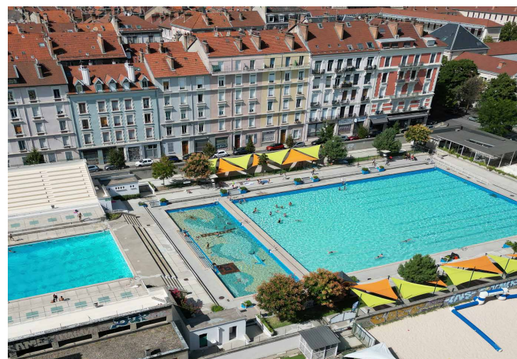
Piscine Jean Bron

Un exemple concret de la prise en compte de la démarche Grenoble 2040 dans les réflexions et les orientations stratégiques de la Ville : la réflexion autour de l'avenir des piscines municipales face au dérèglement climatique. C'est l'un des sujets de redirection écologique sur lesquels travaille la Ville de Grenoble, en lien avec le laboratoire de recherche Origens Medialab. Lieux de pratique sportive et de loisirs, les piscines apportent aussi une fraîcheur bienvenue en été, alors que les canicules se font plus fréquentes. Enjeux de fraîcheur, gestion de la ressource en eau, émissions de gaz à effets de serre... La réflexion sur l'avenir des piscines croise de nombreux sujets. La Ville et Origens Medialab ont travaillé sur un rapport qui explore différents scénarios pour imaginer les piscines municipales de demain.