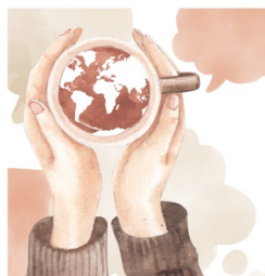
CAFÉ DU MONDE