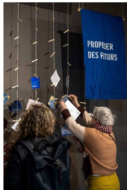
Atelier Raconte-moi tes lendemains qui chantent par Laurence Druon dans le cadre de Réparer le futur.