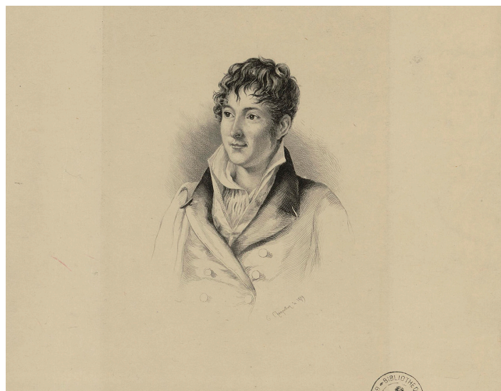
Jacques-Joseph Champollion-Figeac, gravure, 1879