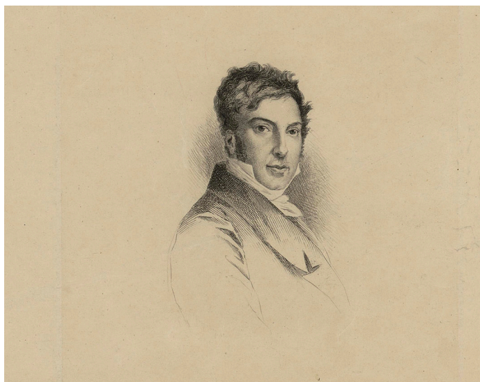
Jean-François Champollion (Le Jeune), gravure, circa 1870

L'exposition permettra de retracer la genèse et le contexte grenoblois d'émulation intellectuelle et culturelle grâce auxquels Jean-François Champollion a mené à bien son grand projet de déchiffrement. Élève de la première promotion du lycée de Grenoble, membre de l'entourage de Joseph Fourier par l'intermédiaire de son frère, un des trois premiers enseignants de la faculté de Grenoble au moment de sa création, bibliothécaire adjoint de la ville, investi dans les débats politiques locaux, Champollion le Jeune est un acteur de la vie sociale et intellectuelle à Grenoble au début du XIXe siècle.