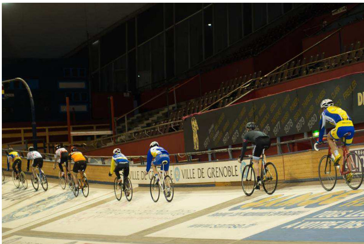
Le cyclisme sur piste amateur est revenu au Palais des sports en 2015 (entraînements et compétitions).

Il n'y a pas d'information disponible sur le nombre de jours d'ouverture annuel et le nombre de personnes accueillies.