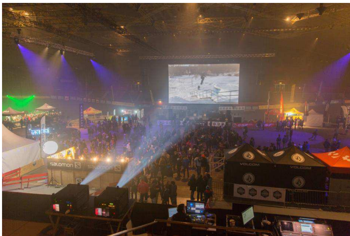
Le Snowboard Garden festival, en octobre 2015. Cette manifestation a trouvé le lieu adapté, après avoir tenté deux éditions au Stade des Alpes.