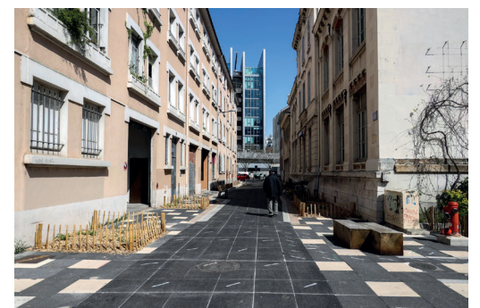
Place aux enfants, piétonisation et aménagement de la rue Anthoard