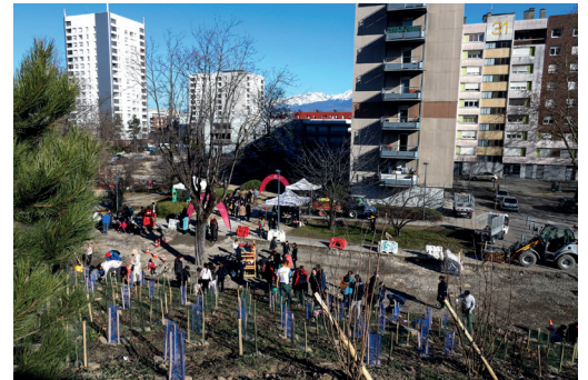
Chantier ouvert au public pour la plantation d'arbres sur le mur anti-bruit de l'A480, quartier Mistral.

La concertation se poursuit pour l'aménagement définitif des place(s) aux enfants. Une première phase de travaux débutera dès cet été et une seconde à la Toussaint, pour 9 écoles supplémentaires (Beauvert, Christophe Turc, Marceau, Bajatière, Menon, Paul Bert, Clémenceau, Malherbe et Daudet). Les plantations de végétaux auront lieu à l'automne ou en hiver pour qu'ils s'épanouissent correctement. A terme, les 50 établissements scolaires publics de Grenoble auront leur Place(s) aux enfants.