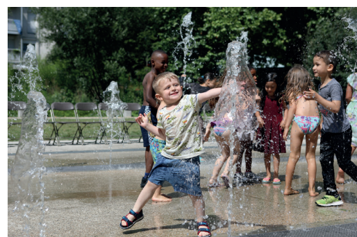
Jardin des Vallons Enfant qui joue