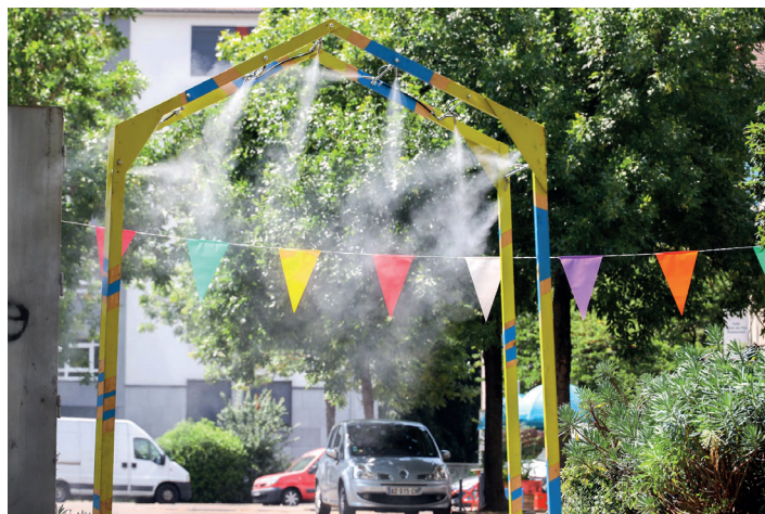
La Rue est vers l'eau, place Charpin, Abbaye