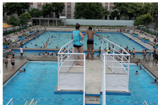
Piscine Jean Bron