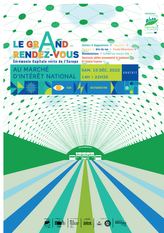
© Agence Grenoble Capitale Verte de l'Europe