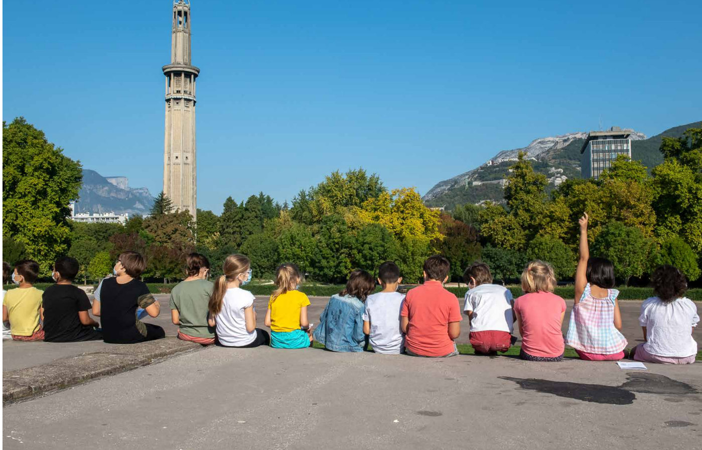
Une classe pendant la crise Covid-19