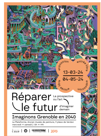
Affiche de l'exposition «Réparer le futur. Imaginons Grenoble en 2040»

Grenoble, membre de l'atelier des futurs, contribue au RARRe (Rapport annuel sur les risques et la résilience dans l'aire grenobloise). À partir de réflexions initiées par l'Agence d'urbanisme, l'Atelier des Futurs s'est engagé dans une démarche exploratoire multifocale et multi échelles. L'objectif : identifier les risques et vulnérabilités dans toutes leurs dimensions et évaluer dans la durée les leviers de résilience du territoire. Cette démarche très inspirée du Global Risks Report de Davos a été baptisée le RARRe, c'est un baromètre local des risques.